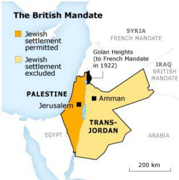
Fig. 4 Mandat britannique 1920-1948 (Wikipédia en juif)

L'Empire ottoman est tombé à la fin de la Première Guerre mondiale, et ses territoires au Levant ont été divisés entre les empires britannique et français, comme le montre la figure 4.