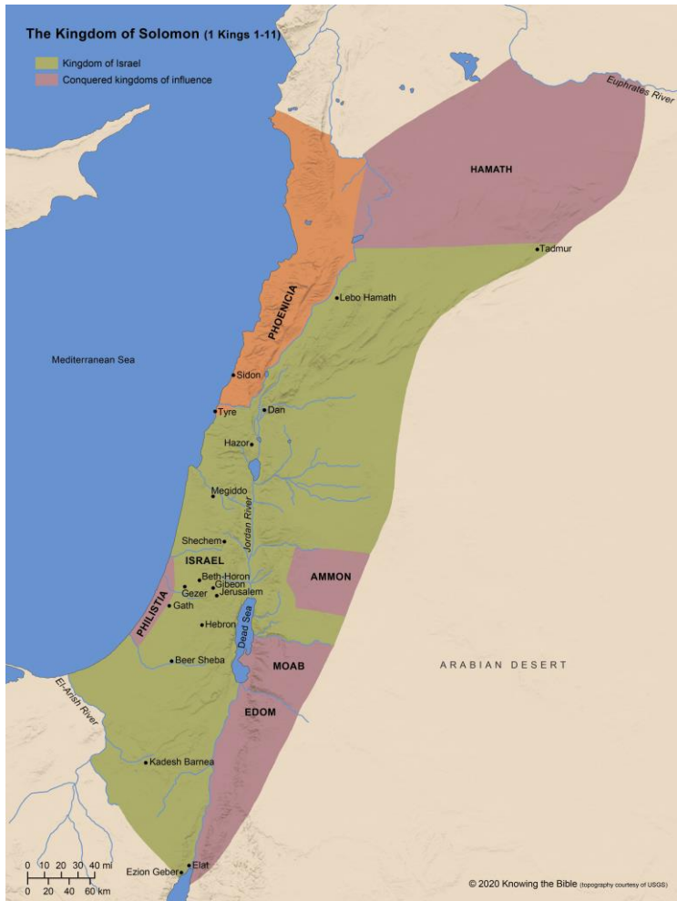
Fig. 1 Israël à l'époque du roi Salomon Qui a hérité des promesses faites à Abraham ?

Abraham a eu huit fils en tout, d'abord Ismaël par Agar la servante égyptienne, puis Isaac par Sarah, puis six autres par Keturah, la femme qu'il a épousée après la mort de Sarah (Genèse 25:1-2).