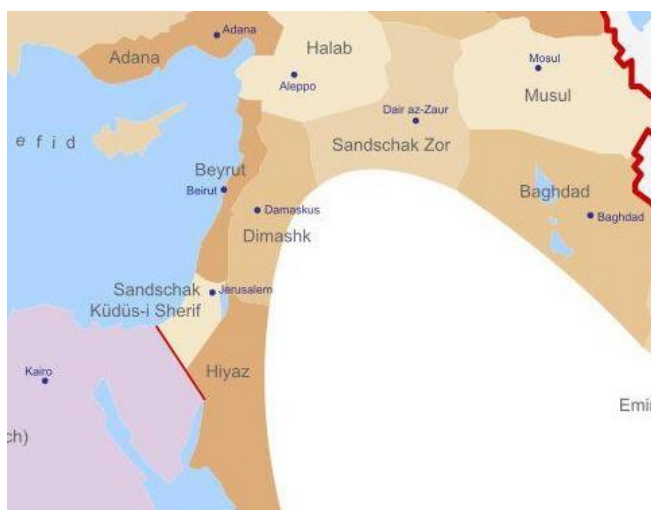
Fig. 3 Le Levant en 1900 (montrant les limites des districts ottomans - Wikimedia commons)

Il est actuellement normal de parler de la « Palestine » comme si elle devait être un État à l'intérieur de ce territoire, même si ses principaux défenseurs planifient tous la destruction d'Israël. Le récit biblique suggère que cette position est instable et que ces choses n'arriveront pas.